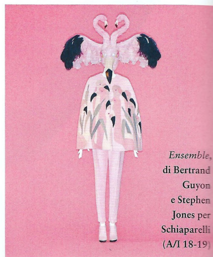
Ensemble, di Bertrand Guyon e Stephen Jones per Schiaparelli (A/I 18-19)