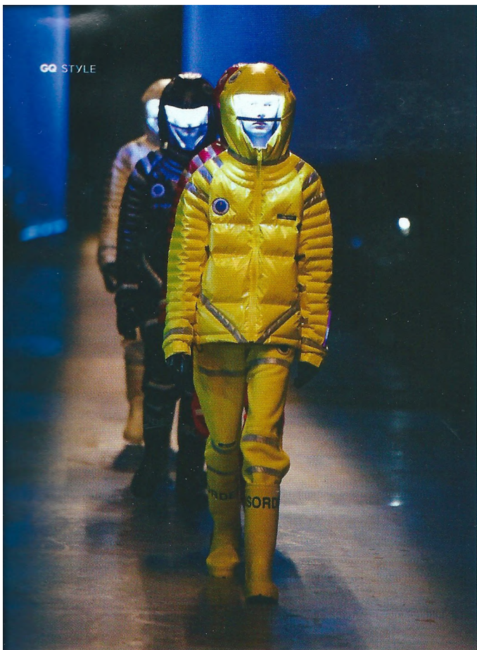
UNDERCOVER by Jun Takahashi (gennaio 2018). La mostra al Museo della Moda e del Costume di Palazzo Pitti a Firenze è visitabile fino al 29 settembre