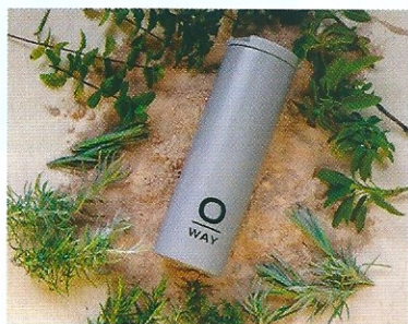
Da sinistra, Stilla, la bottiglia termica in regalo con l'acquisto di tre solari. Lavanda coltivata con metodo biodinamico.