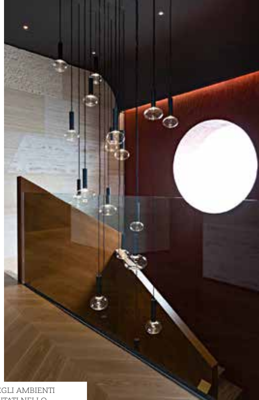
ALCUNI DEGLI AMBIENTI RAPPRESENTATI NELLO SHOWROOM: LA ZONA UFFICIO CON AREA RELAX, IL VANO SCALA E L'AREA PER IL BAGNO.

risparmiando tempi, risorse e costi. Novecento metri quadri dedicati a ventisei aziende per il settore del contract, una piattaforma innovativa in grado di risolvere ogni problema di progettazione dei materiali. Nello spazio espositivo si armonizzano le più diverse competenze, tra le quali quelle di aziende come Agha, Alice Ceramica, Ardeco, Artesi, Barausse, Castaldi Lighting, Delta Dore, Diquigiovanni, Dnd, Dorelan, Florim, Garbelotto, K-array, KE, Londonart, Mareno, Margraf, Milani, Nahoor Limelight, Nord Resine, Oikos, Palazzani, Pianca, Santo Passaia, Talenti, Vitrik. Lo showroom si presenta come uno spazio flessibile, in grado di rinnovarsi per raccontare l'evoluzione delle proposte: arredi, porte per interni, porte blindate, vetrate, boiserie, carte da parati, apparecchi d'illuminazione e sistemi per ufficio. Si sviluppa su due piani, in un percorso espositivo attraverso materiali, prodotti e sistemi delle aziende. Il progetto è a cura dello studio Calvi Brambilla: "Abbiamo lavorato secondo una doppia strategia: da una parte abbiamo selezionato le proposte più interessanti di ogni brand, dall'altra abbiamo cercato di dare un'identità marcata all'allestimento. Abbiamo voluto che ci fosse un segno forte nell'organizzazione spaziale, che desse carattere all'ambiente, indipendentemente dai mutamenti periodici dell'esposizione. Per questo abbiamo introdotto elementi