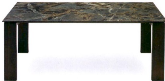
ATLANTIS by Riflessi. Funzionale e versatile, in diverse misure, ha linee essenziali e rigorose. riflessi.it