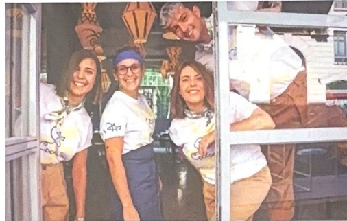
Lo staff della trattoria Polpo, in via Melzo.

La boulangerie francese Égalité ha aperto il secondo punto vendita in zona Brera, dopo quello di via Melzo, e presto ne arriverà un terzo all'Arco della Pace. Ai tavolini affacciati su una delle più antiche e scenografiche piazze della città si ordina la novità Roll Croissant, una versione à la française dei croissant a forma di rotella, ultima mania dei newyorchesi da poco sbarcata anche a Milano (piazza San Simeoniano 7, egalitemilano.it). A Porta Nuova la caffetteria EL&N , celebre per il design degli interni (led alle pareti, pavimenti di marmo con motivi geometrici, tinte pastello come il rosa e il verde), ha inaugurato, nei giorni di sabato e domenica, una linea di quattro proposte di brunch con la possibilità di personalizzare il cappuccino o le bevande a base latte con l'immagine che si pre-