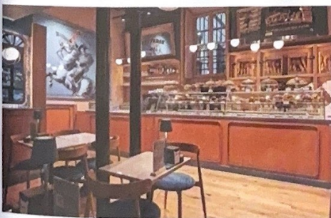
La boulangerie Égalité , a Brera; il rinnovato Arabesque Café , vicino a largo Augusto.